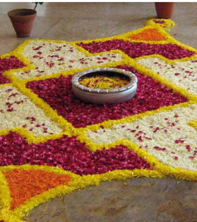
Созданная вручную мозаика из лепестков

(Редактор и ее коллега не имели возможности посетить все презентации)