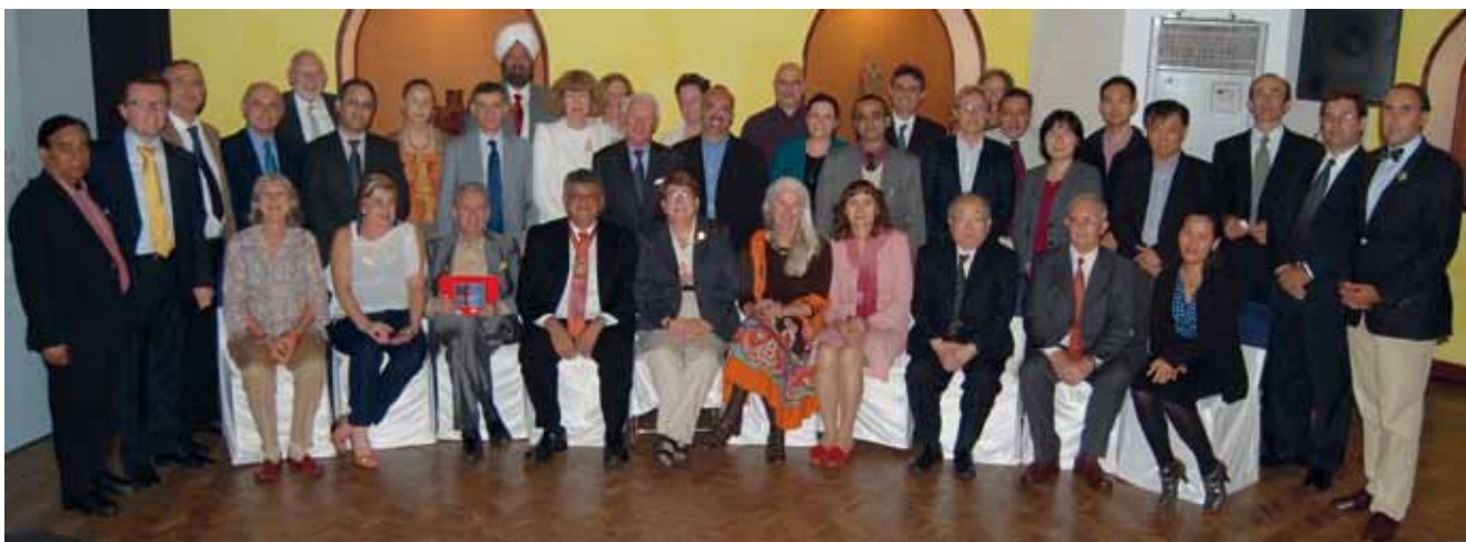
Встреча международного Совета в отеле Taj Ambassador в Нью Дели, Индия