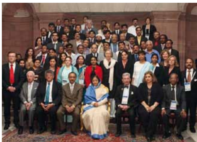
Групповая фотография с ее превосходительством Smt. Prathibhadevi Singh Patil, Президентом Индии, в Президентском доме, Нью Дели

Полное собрание все докладов с 66 Конгресса LMHI 2011 года скоро можно будет заказать он-лайн по почте ligainfo2011@gmail.com . Сувенирную книгу LMHI 2011, выпущенную Sri Ghulam Nabi Azad во время церемонии открытия Конгресса, можно бесплатно скачать с сайта Конгресса 2011 www.liga2011.in .