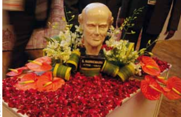
Церемония открытия Конгресса LMHI 2011

Гомеопатия продолжает свое движение, несмотря на уменьшение количества пациентов. Контракты с государственными страховыми компаниями делают возможными возмещения. Разные гомеопатические школы следуют общей программе. Конгресс Немецкой Ассоциации Врачей-Гомеопатов (DZVhA) в 2001 году в Аахене собрал более 40 докладчиков из Нидерландов, Бельгии и Германии, 600 международных участников, и был посвящен теме «Гомеопатия без границ? Пик гомеопатического опыта в науке и практике». PR-кампания против гомеопатии вызвала очень мало публичного резонанса. В ноябре 2010 года было основано Немецкое Научное Общество Гомеопатии в Кетене. Фонд продвижения и поддержки комплементарной медицины Carstens опубликовал информацию о клинических испытаниях (см. www.cam-quest.org ). Магистерская программа, которая планировалась в Университете Магдебурга, не будет проводиться, так как университет отказался от своих намерений. Поиск новых партнеров продолжается.