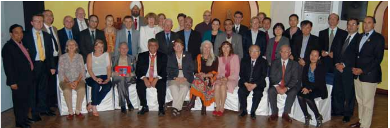
Los miembros del Consejo Internacional reunidos en el Taj Ambassador Hotel, Nueva Delhi, India