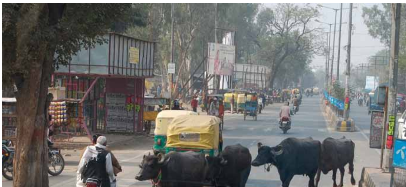
El autobús turístico se detiene para dejar que el ganado cruce la transitada autovía.