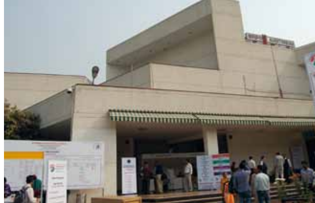
La sede del Congreso: el Auditorio Sirifort, Nueva Delhi, India

individualmente a cada Expresidente, otorgándoseles un certificado oficial acreditativo.