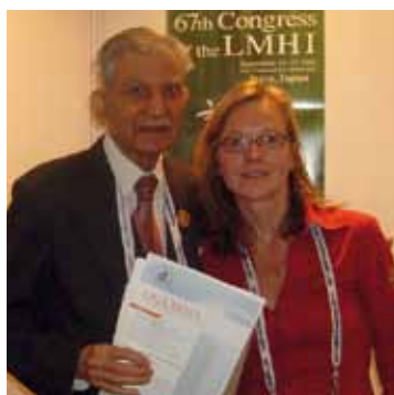
el Dr. Chand visita el Stand de la Liga en el 66° Congreso

07 de marzo de 1924 - 13 de diciembre de 2011