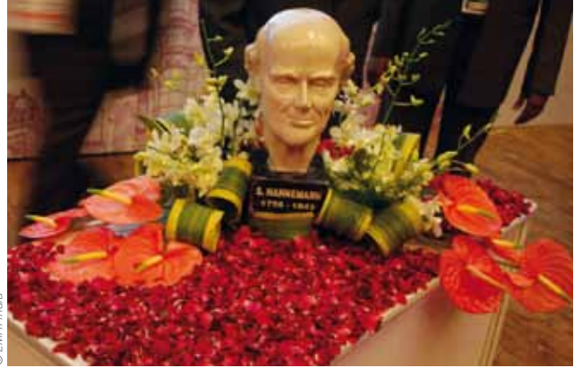
Ceremonia Inaugural del Congreso de la LMHI 2011